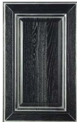
NERO ARGENTO, BLACK/SILVER NEGRO PLATA, NOIR ARGENT, ЧЕРНЫЙ СЕРЕБРО, ΜΑΥΡΟ ΑΣΗΜΙ