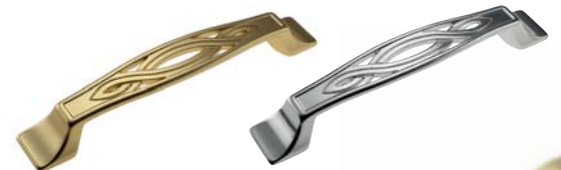
MANIGLIA COLORE ORO TRAFORATA, PERFORATED GOLD HANDLE, TRADOR COLOR ORO CALADO, POIGNEE COULEUR OR AJOURÉE, РУЧКА ЦВЕТА ЗОЛОТО С ПЕРФОРАЦИЕЙ, ΧΕΙΡΟΛΑΒΗ ΧΡΥΣΟΥ ΧΡΩΜΑΤΟΣ ΔΙΑΤΡΗΤΗ