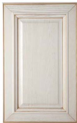
BIANCO/ORO, WHITE/GOLD, BLANCO ORO, BLANC OR, БЕЛЫЙ ЗОЛОТО, ΛΕΥΚΟ ΧΡΥΣΟ