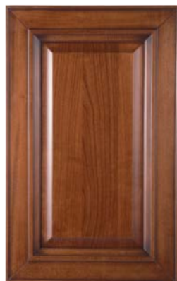
CIJEGIO /CHERR, CEREZO MERISIER, ВИШНЯ, ΚΕΡΑΣΙΑ

DOORS - PUERTAS - PORTES - СТВОРКА - ПОРТА