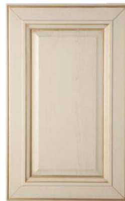
CREMA/ORO, CREAM/GOLD, CREMA ORO, CRÈME OR, ΚΡΕΜΟΒΥΙΟ ΖΟΛΟΤΟ, ΚΡΕΜ ΧΡΥΣΟ