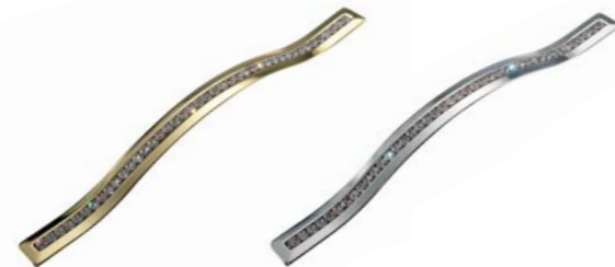
MANIGLIA COLORE ORO LUCIDO CON SWAROWSKI, POLISHED GOLD HANDLE WITH SWAROWSKI CRYSTALS, TRADOR COLOR ORO BRILLANTE CON SWAROWSKI, POIGNEE COULEUR OR BRILLANT AVEC CRISTAUX SWAROWSKI, РУЧКА ЦВЕТА ЗОЛОТО ГЛЯНЦЕВЫЙ С SWAROWSKI, ΧΕΙΡΟΛΑΒΗ ΧΡΥΣΟΥ ΧΡΩΜΑΤΟΣ ΓΥΑΛΙΣΤΕΡΗ ΜΕ SWAROWSKI

HANDLES/KNOBS - MANIJAS/TRADORES - POIGNEES / POMMEAUX - РУЧКИ/РУКОЯТКИ - ΧΕΙΡΟΛΑΒΕΣ/ΠΟΜΟΛΑ