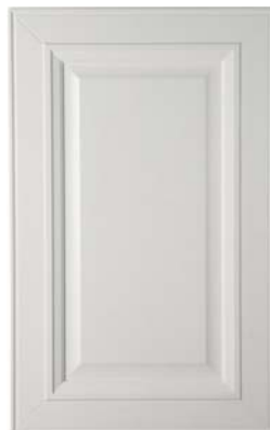
BIANCO, WHITE, BLANCO, BLANC, БЕЛЫЙ, ΛΕΥΚΟ