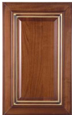
CIJEGIO/ORO, CHERRY/GOLD, CEREZO ORO, MERISIER OR, ВИШНЯ ЗОЛОТО, ΚΕΡΑΣΙΑ ΧΡΥΣΟ