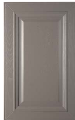
FANGO, CLAY, BARRO, BOUE, ΓΛΙΝΑ, ΧΡΩΜΑ ΛΑΣΠΗΣ